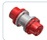
Plans 2D et 3D