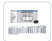
Fiche PDF, vidéos...

Si vos produits sont complexes ou présentent de nombreuses variantes, CADENAS peut créer un configurateur. Vos clients ou commerciaux peuvent ainsi en quelques clics réaliser un produit sur-mesure.